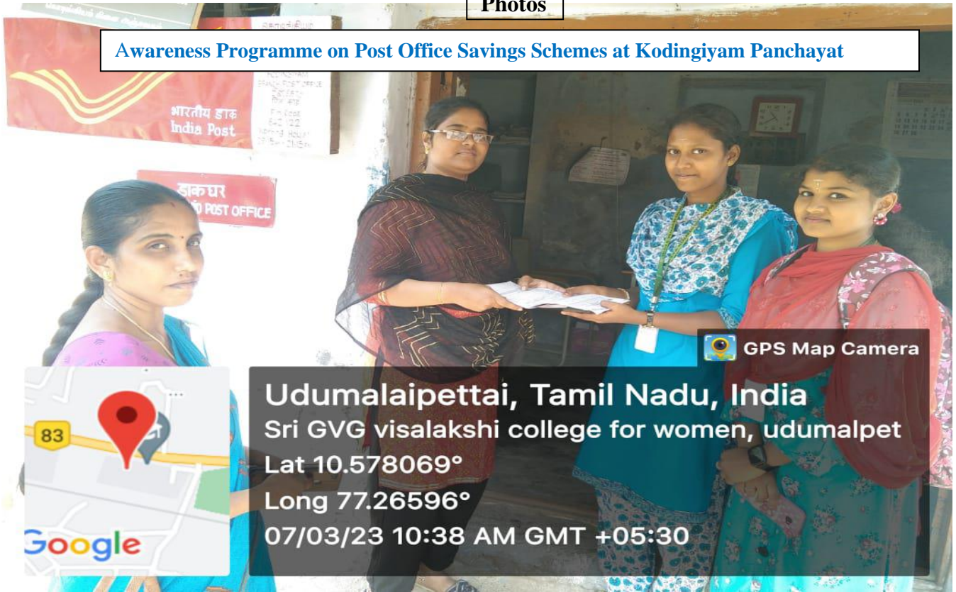
Awareness Programme on Post Office Savings Schemes at Kodingiyam Panchayat